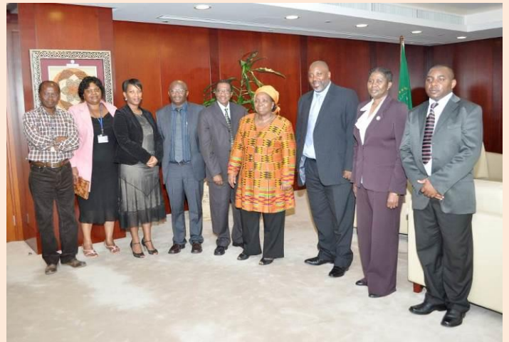
Délégation du FPMA avec le Dr. Mme. Nkosazana Zuma

l'Afrique du Sud auprès de l'UNESCO à Paris.