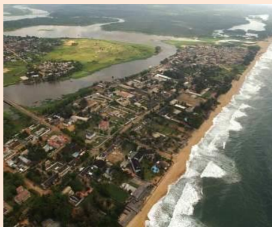
Grand Bassam, Côte d'Ivoire

Ce projet vise à élaborer un plan de gestion des risques pour la ville historique de Grand Bassam inscrite sur la Liste du patrimoine mondial. Grand-Bassam est une ville coloniale côtière qui est souvent exposé à des raz de marée qui peuvent aller jusqu'à une distance d'environ 200 mètres vers l'intérieur. Ces raz de marée peuvent potentiellement détruire certains des attributs culturels importants de la ville, ce qui compromet la valeur universelle exceptionnelle du site.