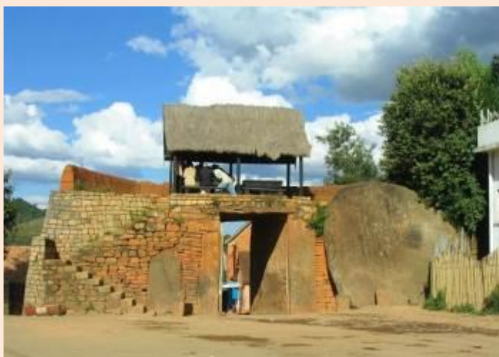
Royal Hill of Ambohimanga, Madagascar

Ce projet vise à actualiser le plan de gestion de la colline royale d'Ambohimanga afin d'assurer une gestion efficace et durable. Des ateliers consultatifs seront organisés avec les parties prenantes concernées afin de recueillir des suggestions et parvenir à un consensus sur la nature du plan de gestion. Le plan de gestion révisé sera présenté aux autorités locales et les parties prenantes en vue d'obtenir un engagement collectif dans la mise en œuvre du plan.