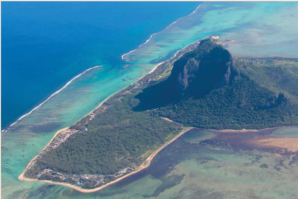
Paysage Culturel du Morne Cultural Landscape, Mauritius