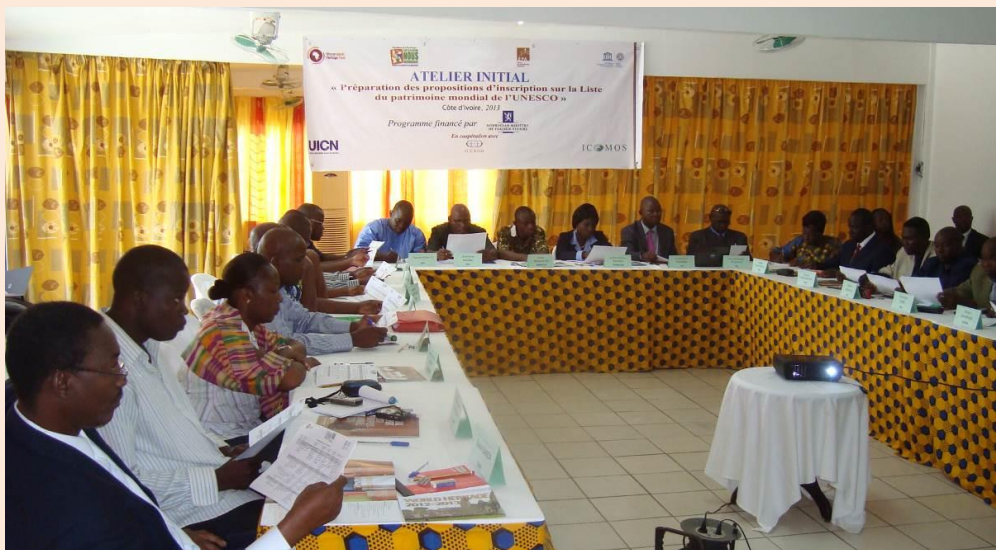
Participants - Cours francophone sur les propositions d'inscription sur la Liste du patrimoine mondial, Côte d'Ivoire

Le FPMA exprime sa reconnaissance envers le ministère norvégien des Affaires étrangères et le Gouvernement de Côte d'Ivoire pour leur précieux soutien à ce cours.