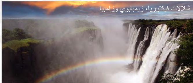
شلالات فيكتوريا، زيمبابوي وزامبيا