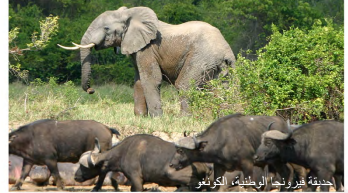
حديقة فيرونجا الوطنية، الكونغو