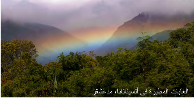
الغابات المطيرة في أيسينانانا، مدغشقر