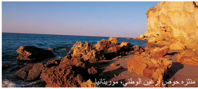
منزّه حوض أرغين الوطني، موريتانيا