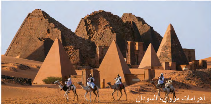
أهرامات مروني، السودان